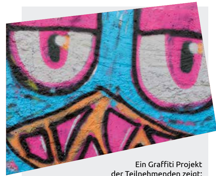
Ein Graffiti Projekt der Teilnehmenden zeigt: Teamwork macht richtig Spaß!

eine Arbeit, eine Qualifizierung für einen Ausbildungsplatz, ein Praktikum, ein Schulabschluss, als auch das Finden geeigneter Unterstützungsangebote für verschiedenste Problemlagen sein. Ein fester persönlicher Ansprechpartner („Lotse“) unterstützt und begleitet die Jugendlichen dabei, eigene Ziele zu entwickeln und diese Schritt für Schritt umzusetzen.